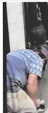
Foto 4: Sustitución de chapas